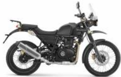
Himalayan 411 + $116.79