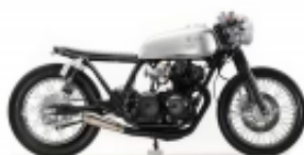
CB 250 Cafe Racer + $0.00