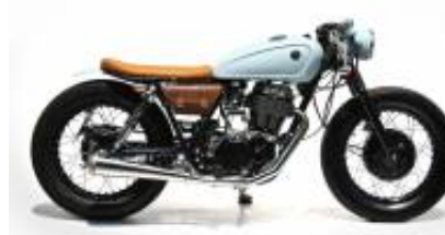
SR 250 Caferacer + $0.00