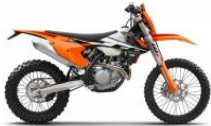
EXC 450 + $0.00