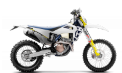
FE 350 + $0.00