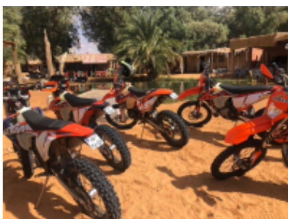
5 - Campement Zmela Labrissa - Djerba - 80