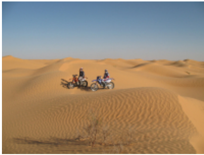
2 - Tataouine - Ksar Ghilane - 120