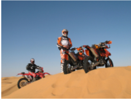
1 - Djerba - Tataouine -