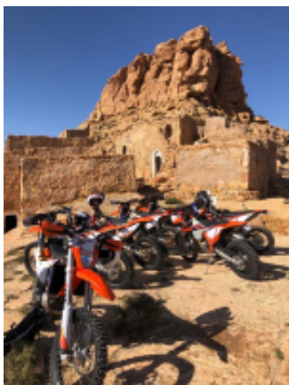
4 - Douz - Campement Zmela Labrissa - 100