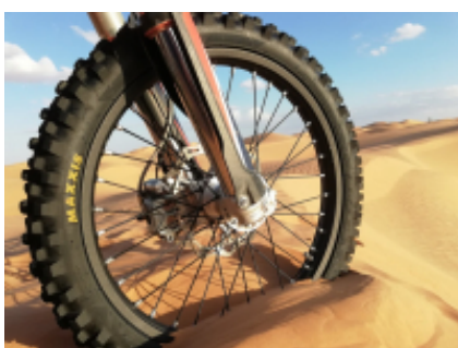
6 - Djerba - Djerba -