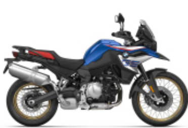
F 850 GS + $58.69