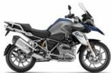
R 1200 GS + $342.70