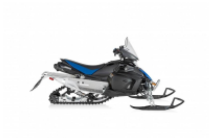
Viking 700 + $0.00