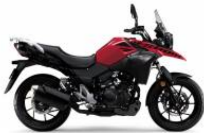
V- STROM 250 + $0.00