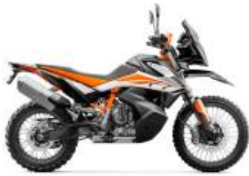
790 Adventure + $2,092.70