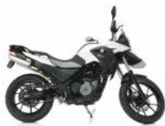
G 650 GS + $0.00