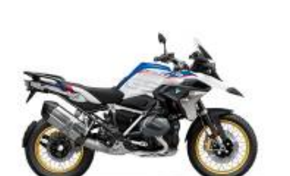
R 1250 GS HP Edition + $0.00