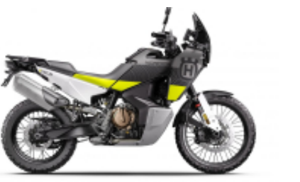
Norden 901 + $0.00