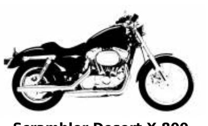
Scrambler Desert X 800 + $0.00