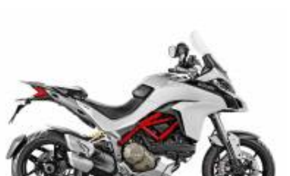
Multistrada 1260 V4 + $0.00