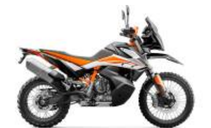
790 Adventure + $0.00