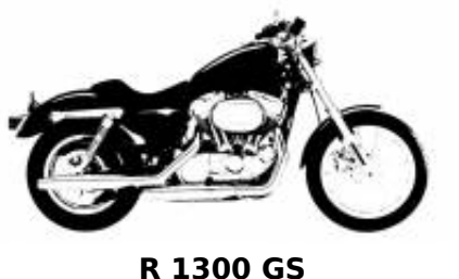
R 1300 GS + $0.00