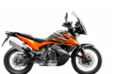
890 Adventure + $0.00