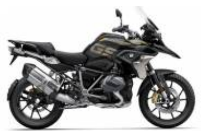
R 1250 GS LC + $0.00