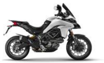
Multistrada 950 V2 + $0.00