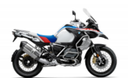
R 1250 GS Adventure + $0.00