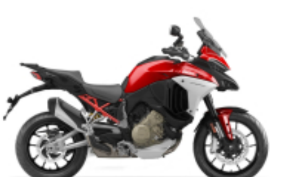
Multistrada V4 + $0.00