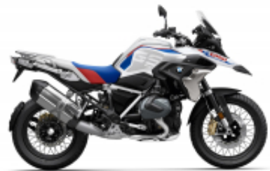
R 1250 GS + $2,174.45