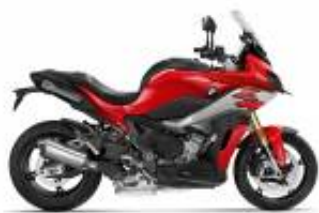
S 1000 XR + $170.90