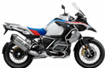
R 1250 GS Adventure + $170.90