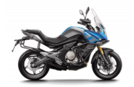
650MT 2022 + $1,194.23