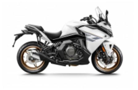
650GT + $1,194.23