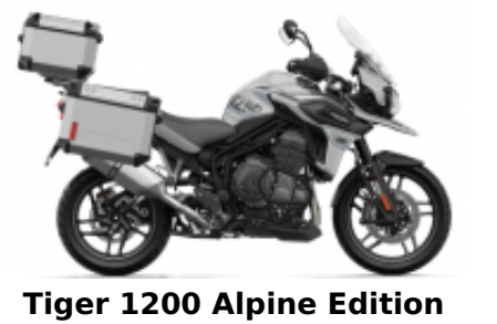
Tiger 1200 Alpine Edition + $2,281.11