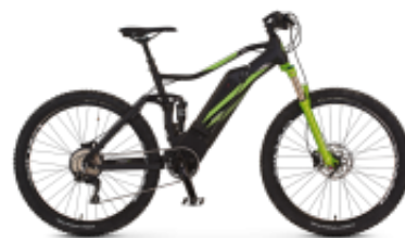
Graveler Sport Drive 10v 27,5 20.ETM.20 + $46.76