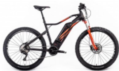
Graveler Sport Drive 10V 27,5 20.ETM.30 + $36.68