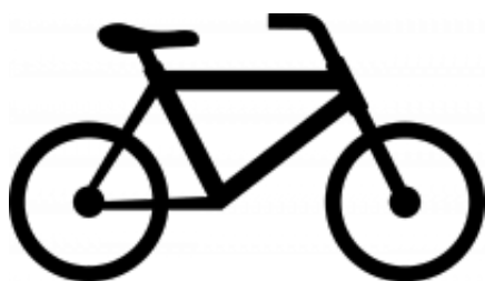
Mi bicicleta + $0.00