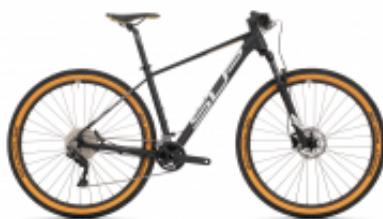
XC 879 + $15.20