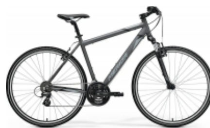
Crossway 20 Man + $18.87