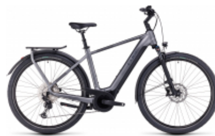
Touring Hybrid 500 One + $35.38