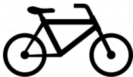
Mi bicicleta + $0.00