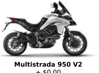
Multistrada 950 V2 + $0.00