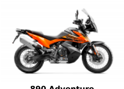
890 Adventure + $0.00