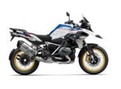
R 1250 GS HP Edition + $0.00