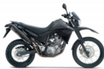
XT 660 R + $1,029.77