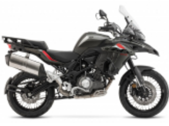
TRK 502 X + $0.00