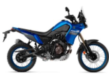
Tenere 700 + $69.81