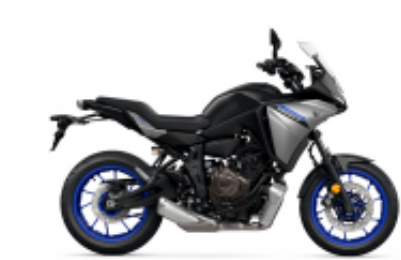
Tracer 700 + $58.17