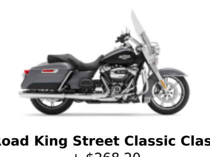
Road King Street Classic Class + $268.20