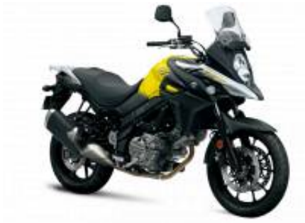
DL 650 V Strom + $0.00