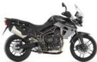
Tiger 800 XRX + $600.00