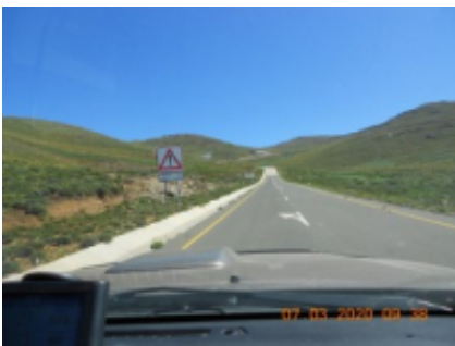
10 - Semonkong - Bethel -