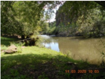
9 - Malealea - Semonkong -