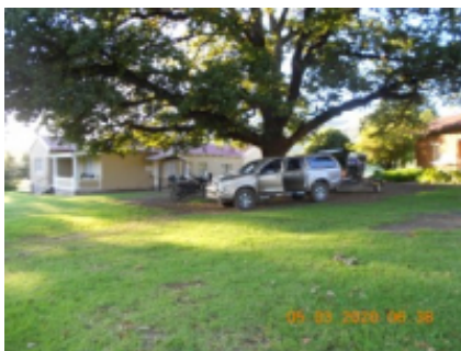
4 - Maclear - Underberg -