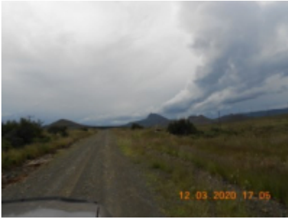
12 - Nieu-Bethesda - Addo -