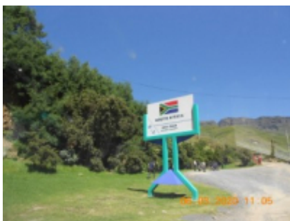
5 - Underberg - Sani Pass -