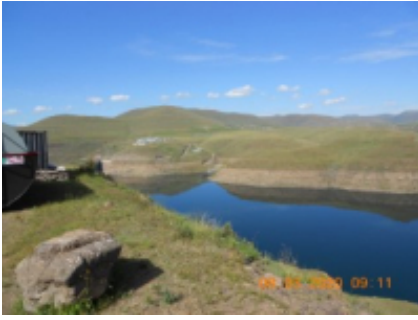
7 - Lejone - Malealea -