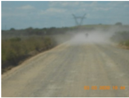
2 - Addo - Hogsback -