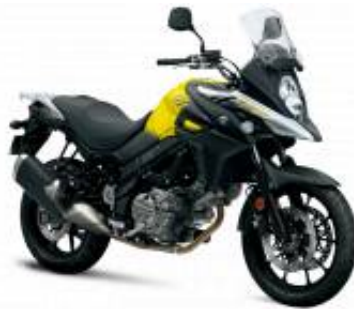
DL 650 V Strom + $0.00