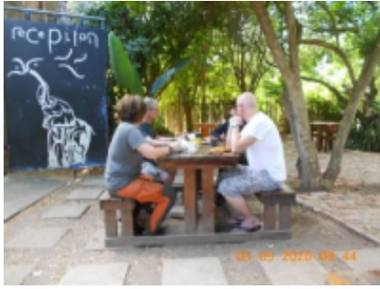
1 - Puerto Elizabeth - Addo -