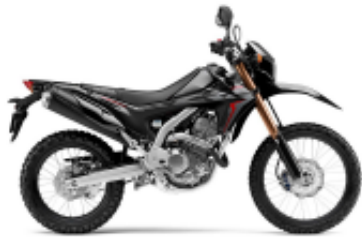
CRF 250 L + $757.01