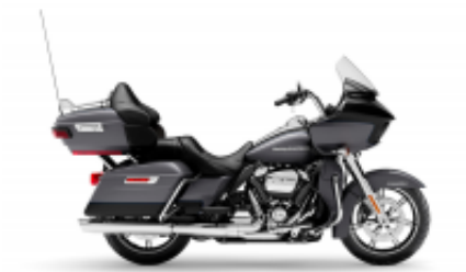
Road Glide Grand Touring Class + $390.00