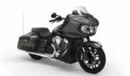
Challenger Street Touring Class + $390.00