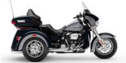
Trike Tri Glide (Gen) + $1,695.00