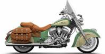
Chief Vintage + $390.00