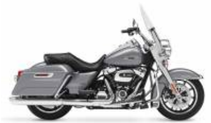
Road King (Gen) Cruiser Touring Class + $260.00