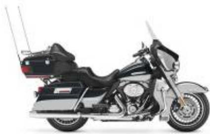
Road Glide Ultra Grand Touring Class + $590.00