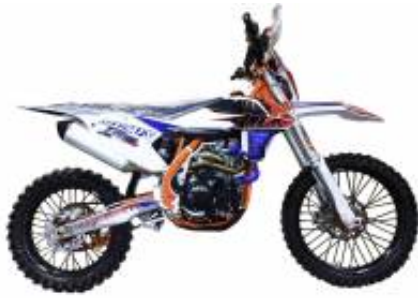
Sixdays 450 + $0.00