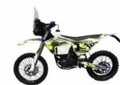
Rally 450 + $0.00