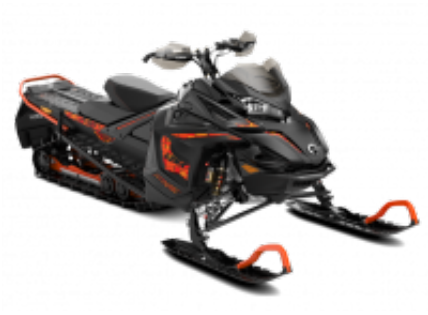
Lynx Xtrim 800 + $349.39