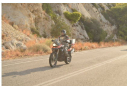
6 - Atenas - Patras - 226