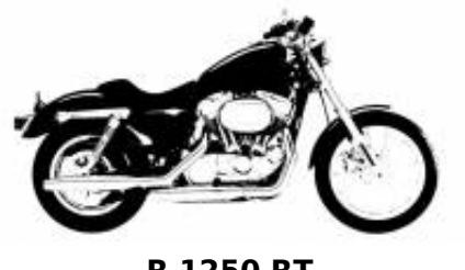
R 1250 RT + $448.83