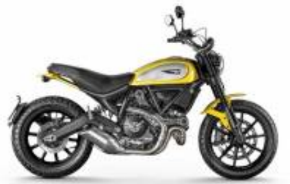
Scrambler Icon 800 + $0.00