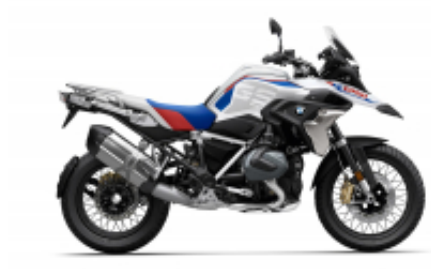
R 1250 GS + $448.83