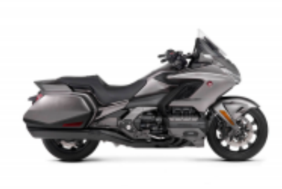
Goldwing DCT 2018 + $763.60