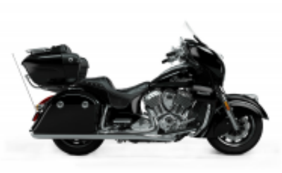
Roadmaster 1890 Grand Touring Class + $763.60