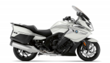
K 1600 GTL + $763.60