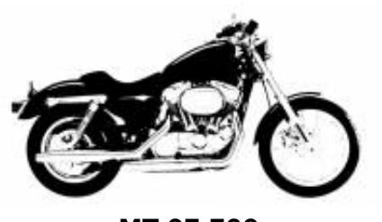
MT 07 700 + $0.00