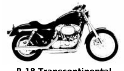
R 18 Transcontinental + $763.60