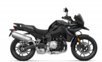
F 750 GS + $0.00