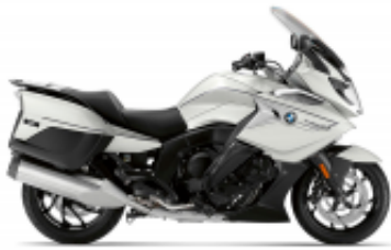
K 1600 GTL + $701.09