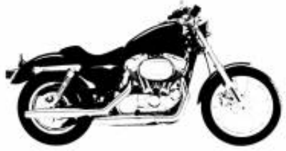
Multistrada V4 + $580.63