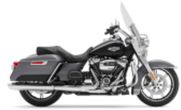
Road King Street Classic Class + $701.09