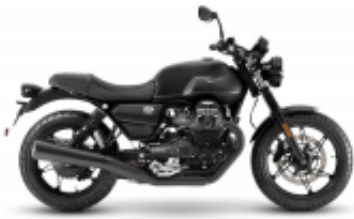
V7 Stone 800 + $0.00