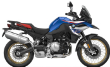
F 850 GS + $290.32