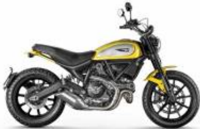
Scrambler Icon 800 + $290.32