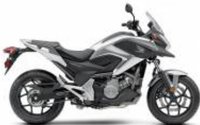
NC 750 X + $0.00