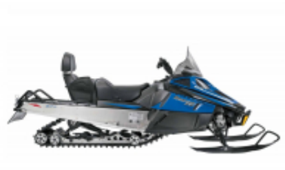
Bearcat XT + $0.00