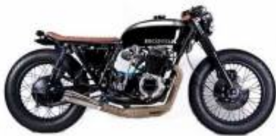
CB 500 Cafe Racer + $0.00