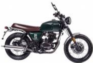
BX 125 + $0.00