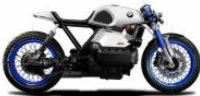
K75 Cafe Racer + $0.00