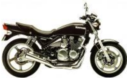
Zephyr 550 + $0.00