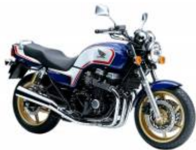
CB 750 + $0.00