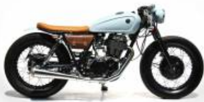
SR 250 Caferacer + $0.00