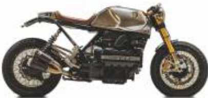
K100 RS Cafe racer + $0.00