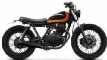
SR125 Caferacer + $0.00