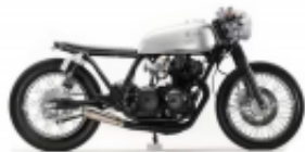
CB 250 Cafe Racer + $0.00