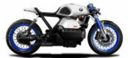
K75 Cafe Racer + $0.00