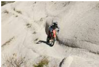
1 - - Antalya -