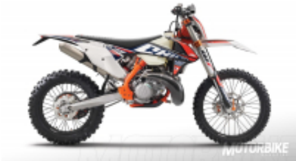
300 2T six days + $685.14