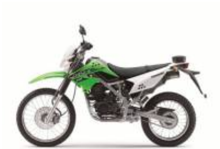
KLX 150 + $0.00