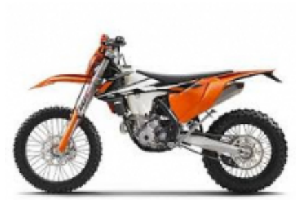
EXC 350 + $685.14