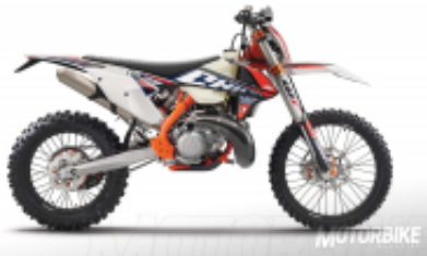
300 2T six days + $686.44