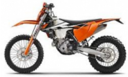
EXC 350 + $676.69