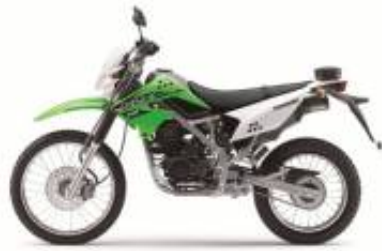
KLX 150 + $0.00