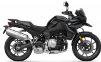
F 750 GS + $535.97