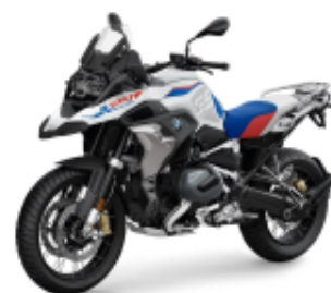
R 1250 GS Rally + $5,335.29