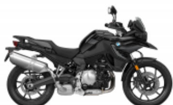
F 750 GS + $3,215.00