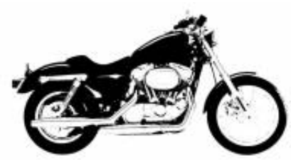
Rally 300 + $0.00