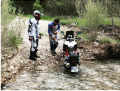
2 - Albaida - Albacete - 180