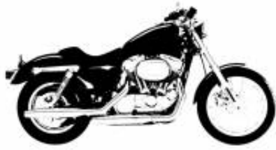
790 Adventure + $522.81