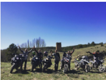
4 - Albaida - Valencia - 130