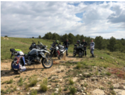
3 - Albaida - Alicante - 200