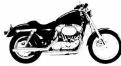
Mein Motorrad + $0.00