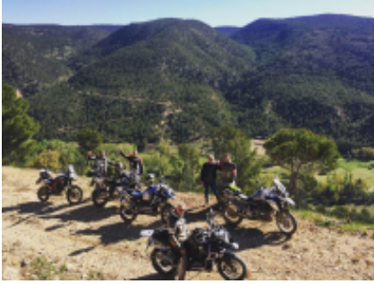
1 - - Albaida -