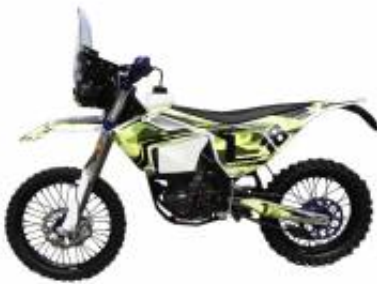
Rally 450 + $0.00