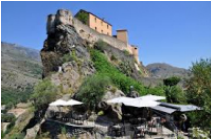
10 - Corte - Corte -