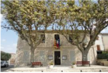
1 - Marseille - Mouriès -