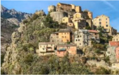
9 - Bastia - Corte -