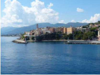
8 - Marseille - Bastia -