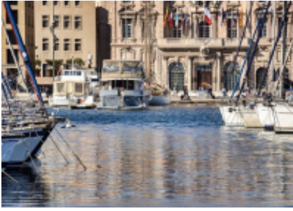
1 - Flughafen Marseille - Marseille -