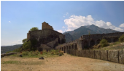
2 - Corte - Corte -