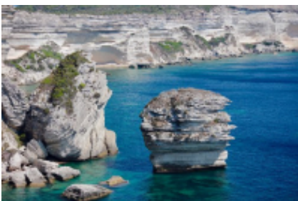
5 - Bonifacio - Marseille -