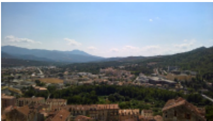
3 - Corte - Corte -