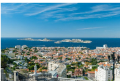
6 - Marseille - Marseille -