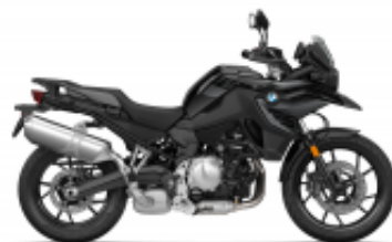
F 750 GS + $0.00