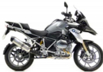
R 1200 GS LC + $519.26