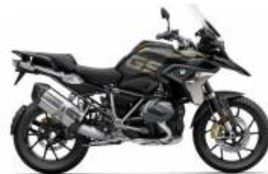
R 1250 GS LC + $576.96