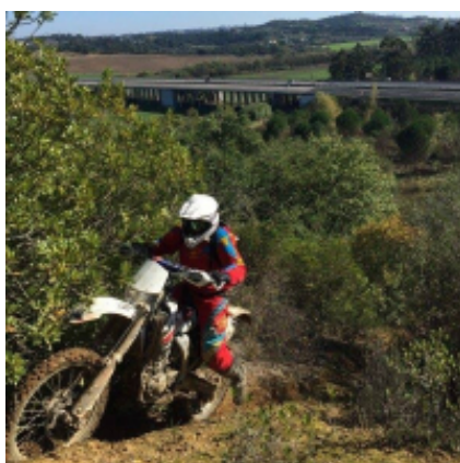
5 - Santarem - Santarem - 140 km