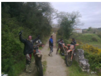
2 - Santarem - Santarem - 160 km