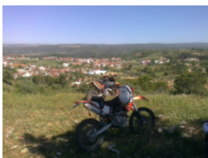
3 - Santarem - Santarem - 150 km