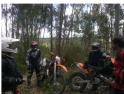
4 - Santarem - Santarem - 160 km