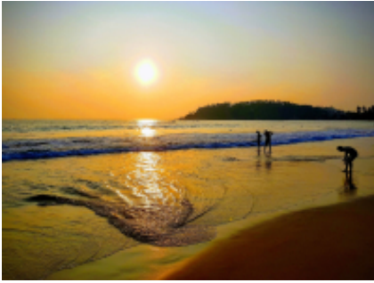
9 - Ella - Tissamaharama - 160