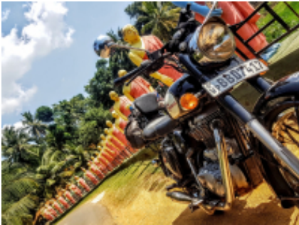
11 - Tissamaharama - Mirissa - 120