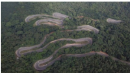
13 - Negombo - -