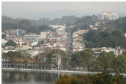
1 - - Colombo - 10