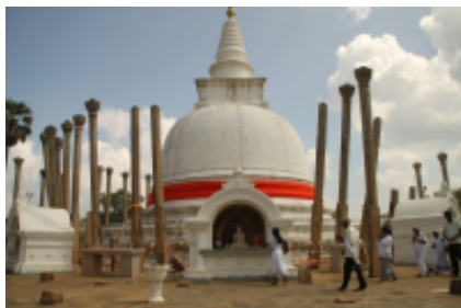
4 - Jaffna - Jaffna - 150