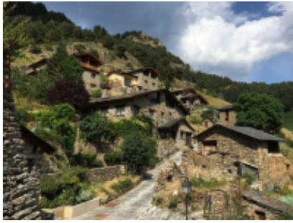
2 - Montpellier - Andorra la Vella -